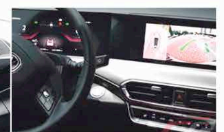
Caméras 3D Haute Définition 360° Avec Enregistreur Dash Cam