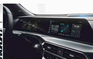
Double Ecran A Cristaux Liquides Haute Résolution De 10,3"