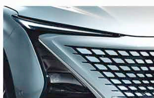
Phares, Feux De Circulation Diurne Et Feux Arrière A Diodes Electroluminescentes (LED)