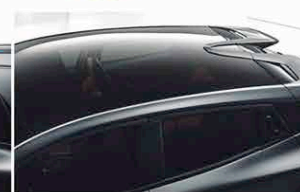
Toit Panoramique En Verre " Skylight " Avec Protection Anti-UV De 97 %